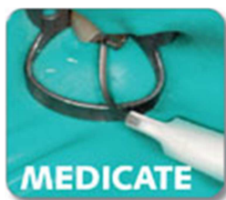
Nałóż wodorotlenek wapnia